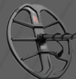
EQUINOX 15™ 探盘, 带护板 15"x12" 椭圆双D型 — 防水深度达5米 [16英尺]